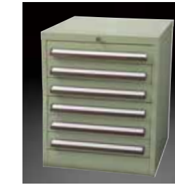
SS(スチールキャビネット) SS(steel cabinet)

六角プラスチックケース小が収納できます。 外寸 W465×D280×H520mm ストック重量 約13kg Can hold small gauge hexagonal plastic cases. External dimensions are W465×D280×H520 and the weight is approximately 13kg.