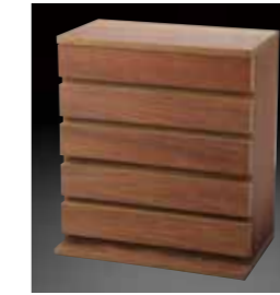
WS(ガラス窓なし) WS (wooden stocker without glass windows)

六角プラスチックケース小が収納できます。 外寸 W465×D280×H520mm ストック重量 約13kg Can hold small gauge hexagonal plastic cases. External dimensions are W465×D280×H520 and the weight is approximately 13kg.