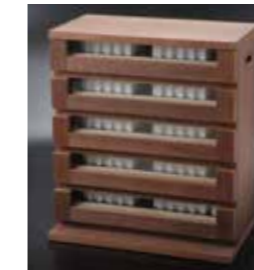
WS(ガラス窓付き) WS (wooden stocker with glass windows)

※ストックのみの別売もいたします。 ※Cabinets also sold individually.