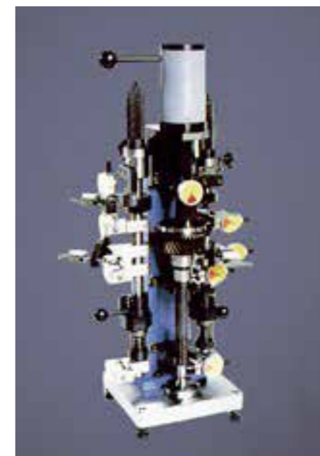
ギアシャフト多点同時測定具 Gear shaft multiple point inspection jig