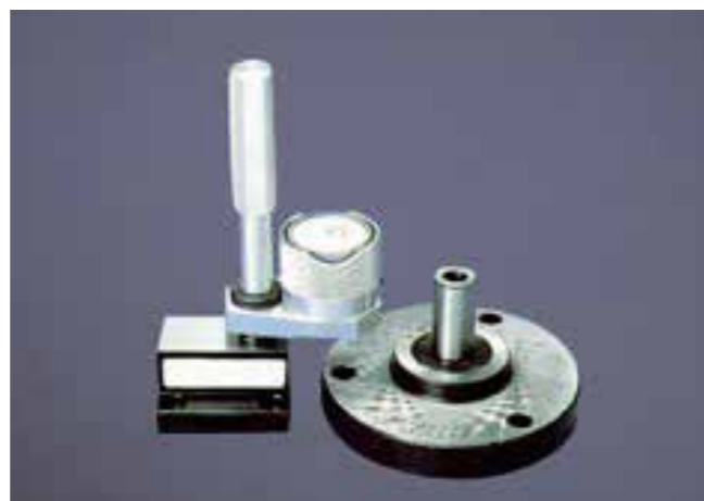
段差測定具 Depth measurement jig