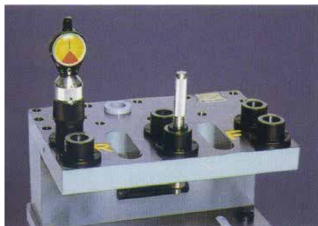
シリンダヘッド基準穴位置測定具 Cylinder head standard hole position measurement jig