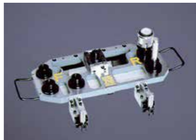
シリンダヘッド基準穴位置測定具 Cylinder head standard hole position measurement jig