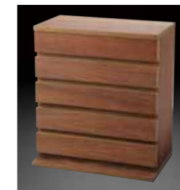
WS(ガラス窓なし) WS (wooden stocker without glass windows)

六角プラスチックケース小が収納できます。 外寸 W465×D280×H520mm ストック重量 約13kg Can hold small gauge hexagonal plastic cases. External dimensions are W465×D280×H520 and the weight is approximately 13kg.