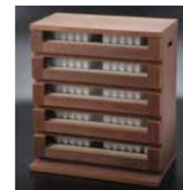
WS(ガラス窓付き) WS (wooden stocker with glass windows)

六角プラスチックケース小が収納できます。 外寸 W465×D280×H520mm ストック重量 約13kg Can hold small gauge hexagonal plastic cases. External dimensions are W465×D280×H520 and the weight is approximately 13kg.