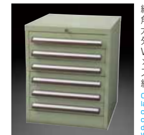
SS(スチールキャビネット) SS(steel cabinet)

※Stocker only is to be sold individually.